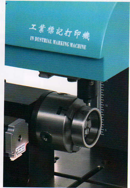
圆周电动打标机 JZ115D Электрическая маркировочная машина на окружности типа ZS115D